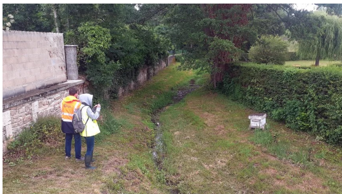
Le ruisseau des Clairs Chênes à Saint-Menges

La communauté d'agglomération Ardenne Métropole engage 22 millions d'euros pour aménager la Meuse et ses affluents dans le bassin sedanais afin de protéger les habitants contre les risques d'inondation et d'améliorer l'état écologique des cours d'eau. Les études ont commencé.