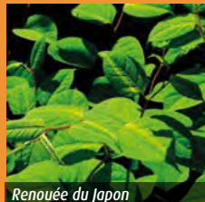
Renouée du japon

Ces plantes en général importées à une époque pour des raisons d'agrément ne sont pas présentes naturellement dans notre région. Elles ont des capacités de développement telles, qu'elles colonisent nos milieux naturels au détriment d'espèces naturellement présentes. Chaque fragment est susceptible de créer une nouvelle repousse. En conséquence, lors des opérations d'entretien, il convient d'évacuer l'ensemble des déchets de coupe. Ils seront ensuite soit jetés en petite quantité avec les déchets ménagers, soit séchés et brûlés (2) .